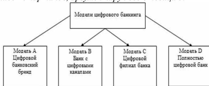
Рисунок 1. Модели цифрового банкинга